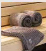
Harvia by Luhta -bastutextiler