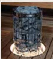
Infällningsram HPC2, belyst infällningsram HPC2L