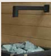
Designrör för badautomaten SASL2M