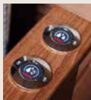
Badautomat autodose SASL1