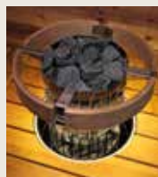
Skyddsräcke HPC3, skyddsräcke med LED-belysning HPC3L