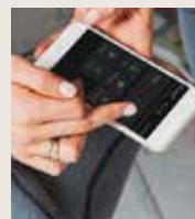
Mobilt fjärrstartsystem FS-SY